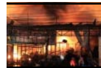
Flammen zerstören Einkaufszentrum in